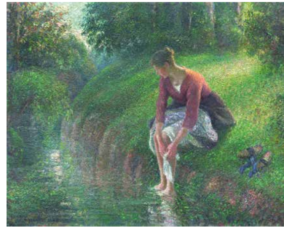
Camille Pissaro. Le Bain de pieds, 1895, The Art Institute of Chicago, A Millenium Gift of Sara Lee Corporation

Le père prodigue. On savait Pissaro ennemi du noir et même des ocres, et strict partisan des trois primaires. On le découvre prosélyte de cette vision auprès des plus jeunes dont il éclaircit la palette et qu'il conseille en mentor bienveillant – ce dont Cézanne lui sera toujours reconnaissant*. C'est un père qui offre un enseignement d'autant plus rare qu'il ne l'a pas reçu, s'étant formé tout seul ou à peu près. Il invente sa leçon au fil de l'eau, guidant le pinceau des autres en éprouvant le sien sur le motif. Figure de patriarche mais non pour autant père de l'impressionnisme (qui en compte déjà tant de supposés avec Corot, Jongkind, Manet, Monet...), sa reconnaissance est tardive, et brouillée par ses recherches permanentes qui déroutent alors les amateurs. Grand travailleur et infailible détecteur de talents (Cézanne, Gauguin, Guillaumin...), il s'engage à cinquante-six ans dans le néo-impressionnisme à la suite de Seurat et Signac, largement ses cadets. On y a vu des errements, une envie un peu ridicule de retrouver une seconde jeunesse en se mêlant à une nouvelle génération, et surtout une impasse, comme le pensait son marchand Paul Durand-Ruel, pourtant fidèle soutien. Deux raisons fortes et sérieuses expliquent cette réorientation: le désir de peindre avec son temps, sans passer à côté de révolu-