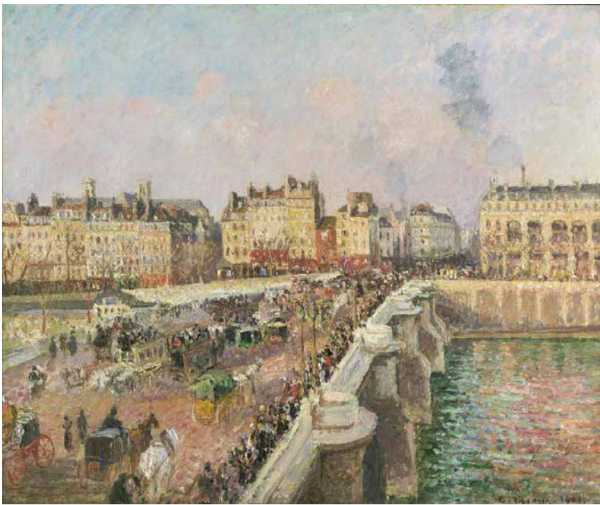
Camille Pissaro. Le Pont-Neuf, après-midi, soleil, première série, 1901. Legs de Charlotte Dorrance Wright, 1978