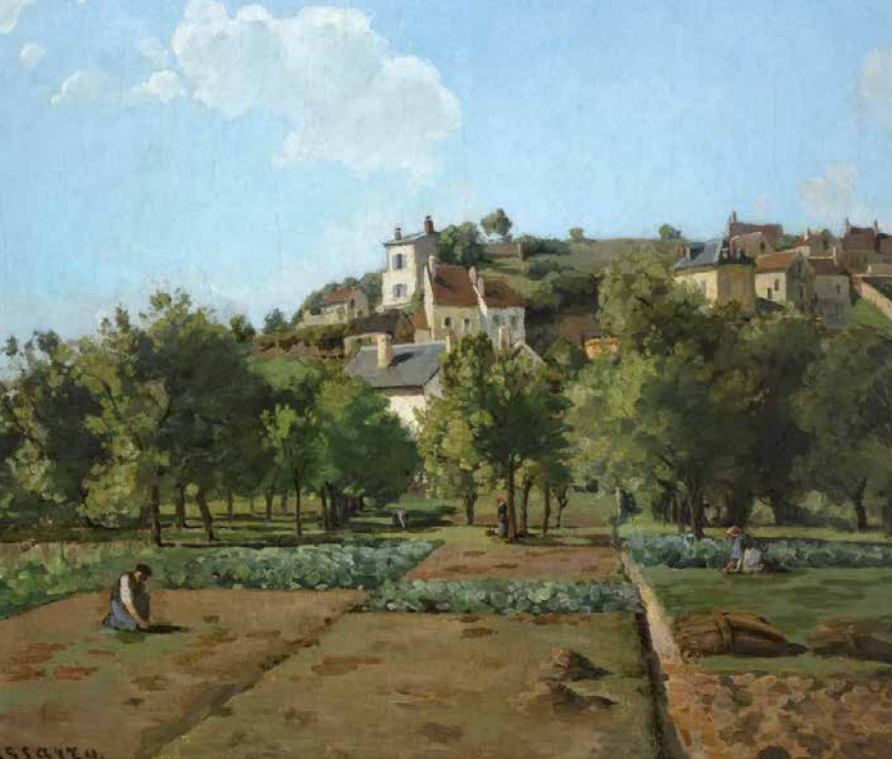
Camille Pissarro. Le Jardin de Maubuisson, Pontoise, vers 1867 , Národní galerie v Praze.