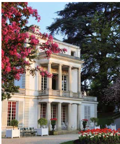
Le Casin

si argentées, si lumineuses et si vivantes... C'est moderne en plein ! » Voilà Pissarro peintre de la modernité urbaine, mais d'une modernité mouvante, chatoyante et brassée, très différente de ce que retenait dans ses perspectives urbaines son ami Caillebotte au tracé d'architecte et à la poétique du vide si personnelle. Tendue vers le mouvement, Pissarro prend la tension de la ville à même ses artères neuves où circule la foule. Caillebotte enregistre,