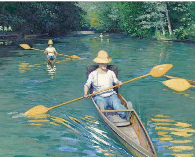
Gustave Caillebotte, Périssoires sur l'Yerres © Ville de Yerres.