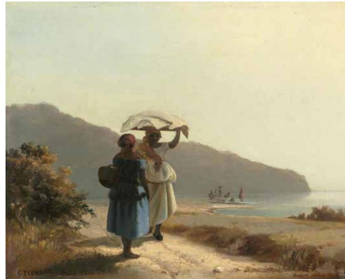
Camille Pissarro. Deux Femmes causant au bord de la mer, 1856, Collection of Mr and Mrs Paul Mellon, Washington, National Gallery of Art