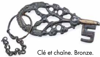
Clé et chaîne. Bronze. Garby, Öland, Suède

N'en déplaise à Wagner, leurs casques n'avaient pas de cornes; celles-ci servaient plutôt à boire, ornées d'argent chez les plus riches, parmi un service complet attestant un usage des bonnes manières à table. On savait aussi s'habiller à l'heure du thing (assemblée locale) et se parer avec un raffinement étendu aux moindres objets du quotidien. Les femmes dirigeaient d'une même poigne de fer exploitation, maisonnée, budget et même destin, qu'elles savaient prédire ou manipuler. Les hommes