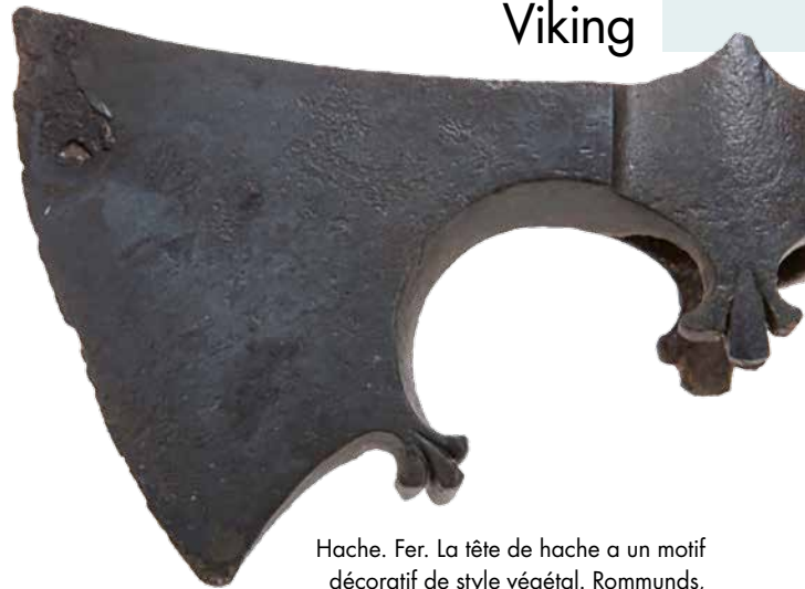
Hache. Fer. La tête de hache a un motif décoratif de style végétal. Rommunds, Gammeln, Gotland, Suède

Figurine de Bouddha. Bronze (copie). L'original provient de la vallée de Swat, dans la partie nord du sous-continent indien, et date du VI e siècle. Helgö, Ekerö, Uppland, Suède