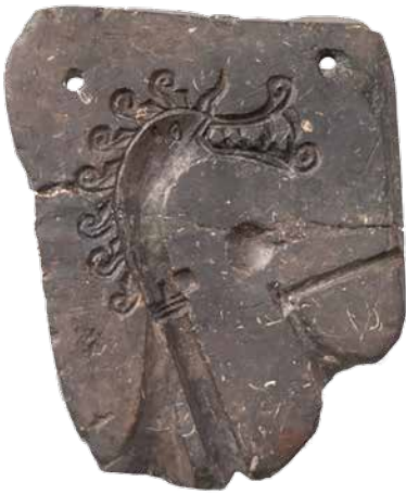
Moule. Stéatite. Ce moule a probablement été utilisé pour couler de fibules. Björkö, Adelsö, Appland, Suède