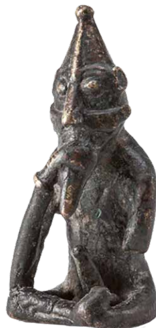
Figurine. Bronze. Généralement considérée comme une représentation du dieu Freyr. Rällinge, Lunda, Södermanland, Suède

Le mot Viking désigne, non pas le nordique que l'on croit, mais son passe-temps favori. À bien lire les runes, ce serait en effet une activité nautique, permettant de se ravitailler à bon prix. Pratiquer le viking en drakkar, ça vous a quand même une autre allure que faire ses courses en cad-die! Voilà l'une des révélations de cette exposition passionnante, qui remet les boussoles à l'heure d'après les plus récentes découvertes scientifiques et a déjà attiré plus de 1,3 million de visiteurs dans le monde. On pensait bien ne pas tout savoir de ces Nordmen, nourrir même quelques préjugés à leur égard: tous pillards, barbares, soiffards, etc. Pour résumer, et par doux euphémisme, on disait que de 793 environ à 1066, d'honorables commerçants (craints par tout leur village, quand même) s'absentaient pour des emplettes à l'étranger, sur de frêles esquifs ornés d'un dragon appelé dreki – d'où drakkar. Selon l'accueil, ils s'attardaient plus ou moins, visitant le pays et en rapportant quelques souvenirs, voire quelques spécimens. Face à cette innocente manie, des conservateurs locaux s'ingéniaient à cacher toujours plus loin les pièces intéressantes, tout en effrayant les enfants par des récits exagérés. Par commodité, on avait fini par laisser un bout de terrain aux visiteurs qui y firent souche, ce qui fait qu'on ne les nomme plus pirates. Eh bien, c'est fini ces histoires, tout comme les vieilles celtitudes brachylocéphales versus dolicocephales. Place aux