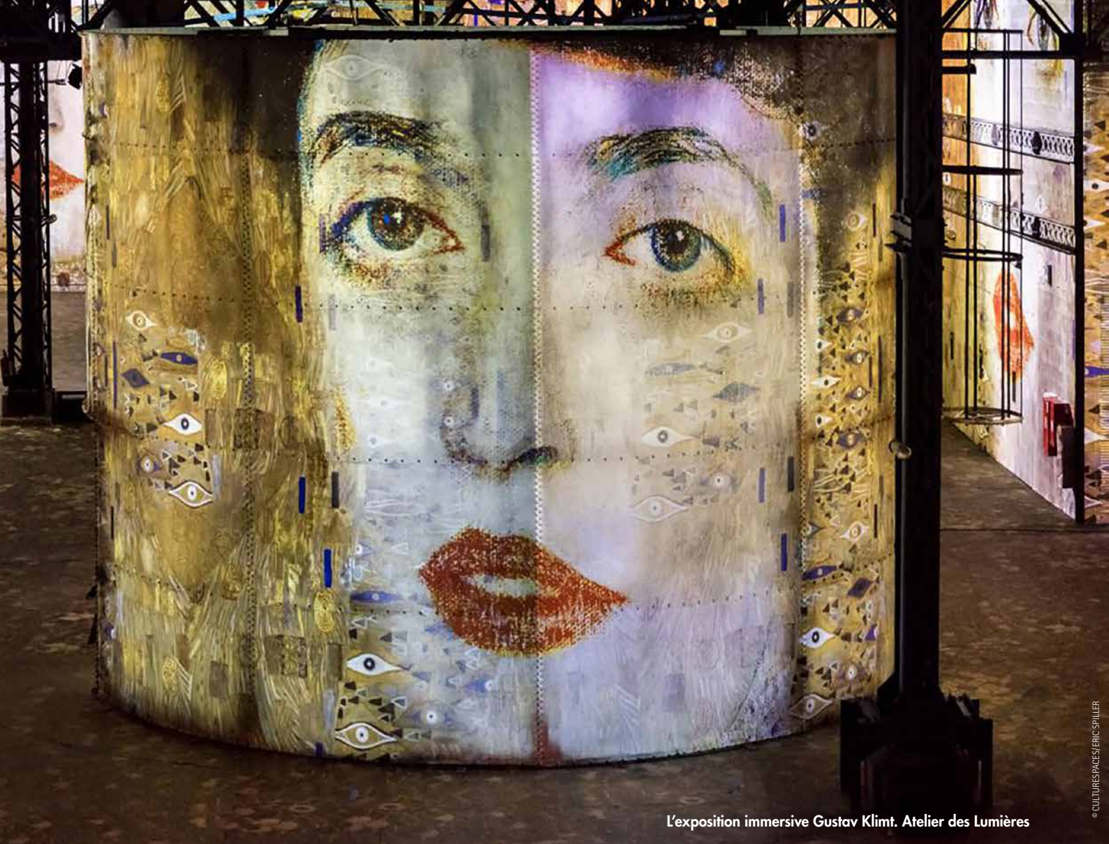
L'exposition immersive Gustav Klimt. Atelier des Lumières