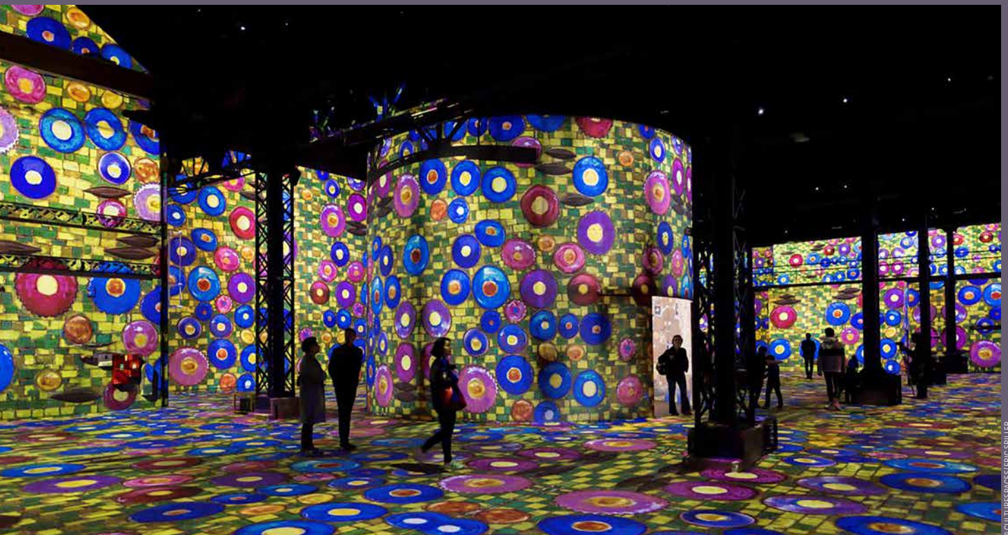
L'exposition immersive Gustav Klimt. Atelier des Lumières