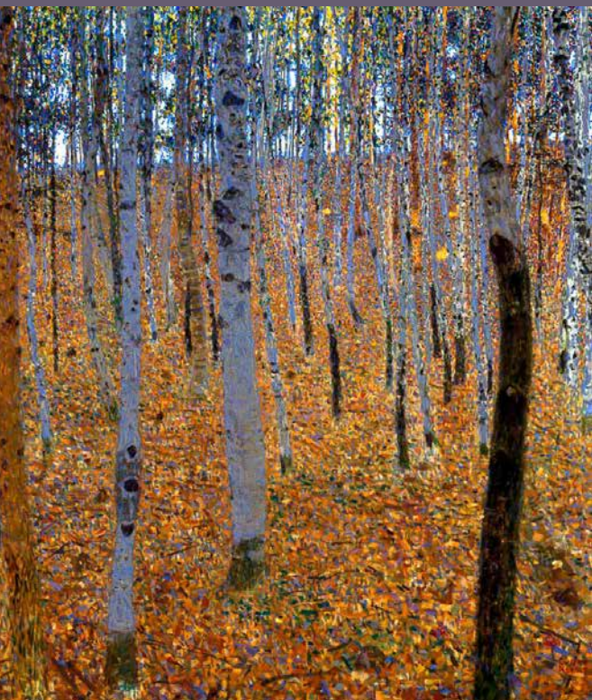
Forêt de hêtres I, Vers 1902.

STAATLICHE KUNSTSAMMLUNGEN DRESDEN, GALERIE NEUE MEISTER, INV. GAL.-NR. 2479 A