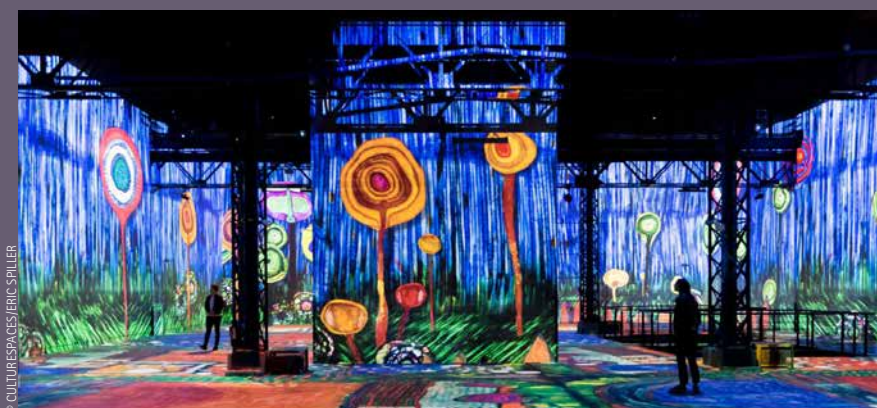
L'exposition immersive Hundertwasser, sur les pas de la succession viennoise. Atelier des Lumières

En cette fin de siècle, la capitale impériale jette l'or par les fenêtres au nom de la grandeur de l'Autriche et le peintre, devenu son maître décorateur après Makart, fait ruisseler cette pluie de lumière avec une égale prodigalité. Il a compris son contrat ; à la tête du mouvement Secession, il invente un art décoratif riche, spectaculaire et total qui recouvre tous les autres, peinture, musique, architecture. Un vertige de prestige saisit la société huppée du Ring et Klimt en réponse enlumine ses murs de frises symbolistes et mythologiques. L'érotisme qui les nimbe fait scandale mais fascine par la note mortifère que le peintre associe à la beauté capiteuse, laissant percer sous la chair épanouie le masque émacié de la camarade. Symbole des cycles de la vie, à l'en croire, cette obsession reflète les troubles d'une ville sensuelle et libre qui découvre l'inconscient et meurt de la syphilis. Au début du nouveau siècle, âge d'or de Klimt et apogée de son style, les plus belles femmes le sollicitent : ses portraits les couvrent d'or, d'argent, de bijoux rutilants, de pierres fines. Sous le voile d'onirisme teinté de saphisme, presque toutes diffusent un charme serpent, vénéneux, fatal. Belles à faire peur, diraient les Précieuses, spectrales dans leurs robes d'or où se fondent les yeux égyptiens, les spirales grecques, les carrés byzantins et les volutes celtiques. Femmes-fleurs aussi, parfois ; elles