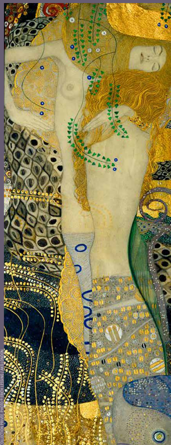
Gustav Klimt, Serpents aquatiques I, 1904-1907. Huile sur toile.

Gustav Klimt L'Atelier des Lumières 38 rue Saint-Maur, Paris 11 e . Prolongé jusqu'au 6 janvier Réservation conseillée sur atelier-lumieres.com