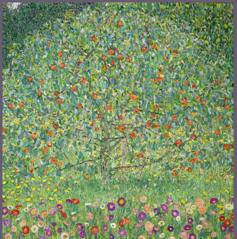
Gustav Klimt, Pommier I, vers 1912.

STAATLICHE KUNSTSAMMLUNGEN DRESDEN, GALERIE NEUE MEISTER, INV. GAL.-NR. 2479 A