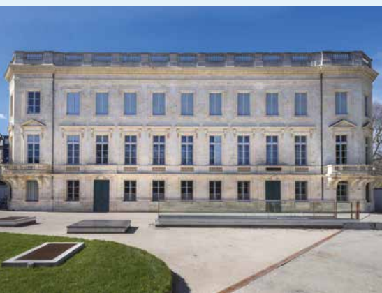
LA FAÇADE ET LE PARVIS DU MUSÉUM DE BORDEAUX

2019 sera un bon cru pour la capitale de la Nouvelle-Aquitaine, qui prend la promesse de sa région au pied du cep. Après la Cité du Vin, voici que s'inaugurent partout en ce printemps de nouveaux lieux culturels qui font honneur à sa vitalité créative. L'occasion est belle, à deux heures désormais de Paris, de lui rendre à très grande vitesse une visite riche de découvertes.