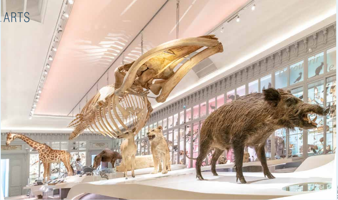
LA GALERIE SOUVERBIE DU MUSÉUM DE BORDEAUX