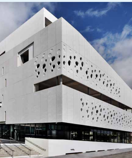
LE MUSÉE MER MARINE

d'exposition de ce bâtiment qui en compte 13 000, entourés de jardins suspendus. Dans la cale et l'entrepont, le visiteur va pouvoir, dès cet été, s'embarquer vers les grandes découvertes et les expéditions d'étude (en essayant quelques batailles navales) et circuler d'escale en escale dans un archipel de plus de 10 000 objets de marine (maquettes, bateaux grandeur nature, instruments de navigation, cartes, atlas...) et d'œuvres d'art recueillies sur plusieurs millénaires. Sur le pont supérieur, place à l'exploration océanographique, racontée depuis les temps géologiques jusqu'aux plus récents aperçus sur une vie des profondeurs sans cesse plus fascinante, et que des solutions permettent encore d'espérer sauver. Le MMM se veut aussi passerelle des expériences et des initiatives autour de la grande bleue, et prévoit des rencontres entre scientifiques, travailleurs de la mer et grand public. En prélude à son ouverture totale dans quelques semaines, il accueille en première mondiale la pêche miraculeuse de deux grands photographes de l'univers sous-marin.