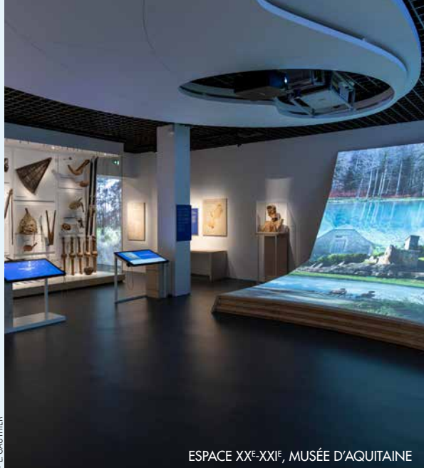
ESPACE XX e -XXI e , MUSÉE D'AQUITAINE