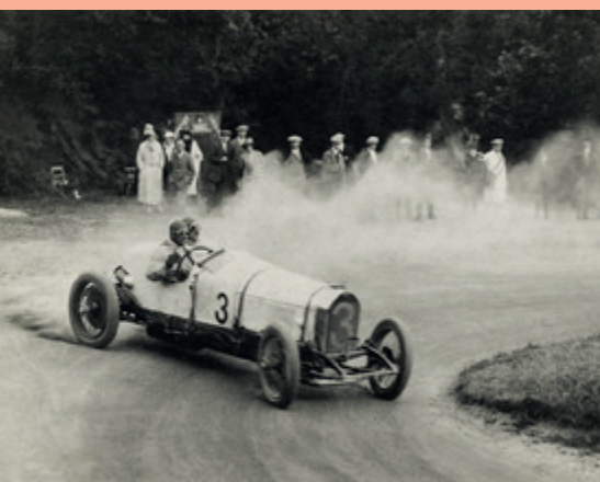
BENTLEY SPEED 2,5 L, LE MANS, 1922

Le 4 juin 1919, André Citroën triomphe: sa 10 HP Type A, au moteur 4 cylindres de 18 ch, est une révolution qui fait sensation parmi les limousines et devant la presse. Elle ne monte qu'à 65 km/h, mais c'est le véhicule populaire qu'il a résolu de produire, dans son usine débarrassée de l'effort de guerre. Les Automobiles Citroën sont nées. S'ensuivront d'inoubliables coups médiatiques dans le ciel ou sur la Tour Eiffel, les très suivies Croisière Noire puis Jaune en autochenilles et le succès en série pour le polytechnicien visionnaire.