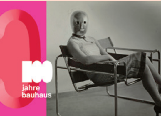
ARIEH SHARON, 1962 / © KLASSIK STIFTUNG WEIMAR / © STEPHAN CONSENMÜLLER (ERICH CONSENMÜLLER)