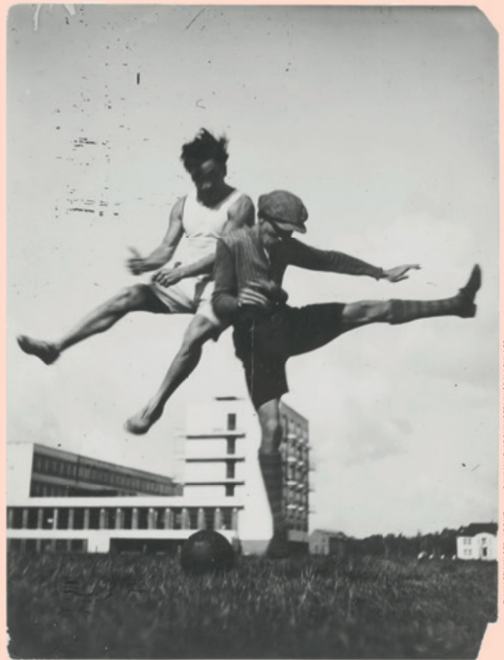
T. LUX FEININGER, ABOUT 1927, BAUHAUS-ARCHIV BERLIN / © NACHLASS T. LUX FEININGER