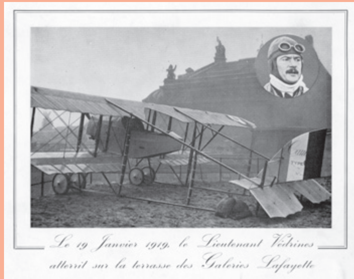
1919 - JULES VÉDRINES POSE SON AVION SUR LE TOIT DES GALERIES LAFAYETTE