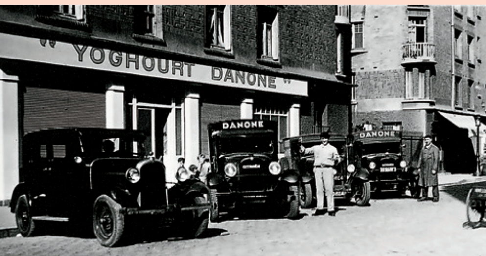
LE PREMIER POINT DE VENTE À PARIS