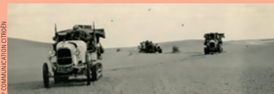
TRAVERSÉE DU SAHARA PAR L'AUTOCHENILLE CITROËN SCARABÉE D'OR

En 1919, l'avion est le symbole absolu d'une modernité qui défie et défie la vitesse et la performance mécanique. Le 19 janvier, l'aviateur Jules Védrines réussit l'exploit d'atterrir en Caudron sur le toit des Galeries Lafayette, et le 7 août Charles Godefroy celui de passer sous l'Arc de Triomphe avec son Nieuport. Cet acte fou a un double but: rendre hommage aux as de 14 et rappeler que l'aviation n'est pas qu'un appoint comme le préjuge l'État-Major, erreur qui coûtera cher en 39. Entre-temps, toujours en 1919, un Farman Goliath, ex-bombardier, a effectué le premier vol avec passagers entre Paris et Londres, et Latécoère, préfigurant l'Aéropostale, a ouvert « la Ligne » Toulouse-Rabat sur des Salmson et des Bréguet 14 à moteur Renault. Beaucoup de motoristes se font constructeurs d'avions ou se reconvertissent dans l'automobile au lendemain de la guerre. Un certain nombre de marques sont ainsi nées en 1919, dont l'élégante Voisin et la très prestigieuse Bentley, qui fête ses cent ans au Mans, et à Chantilly en juin. Le double centenaire de l'Aéroport