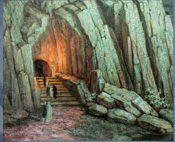
GAND, COLLECTION BODDAERT