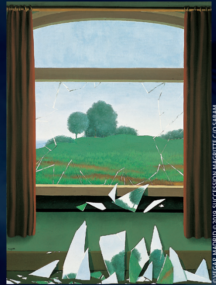
RENÉ MAGRITTE, LA CLEF DES CHAMPS, 1936, HUILE SUR TOILE.