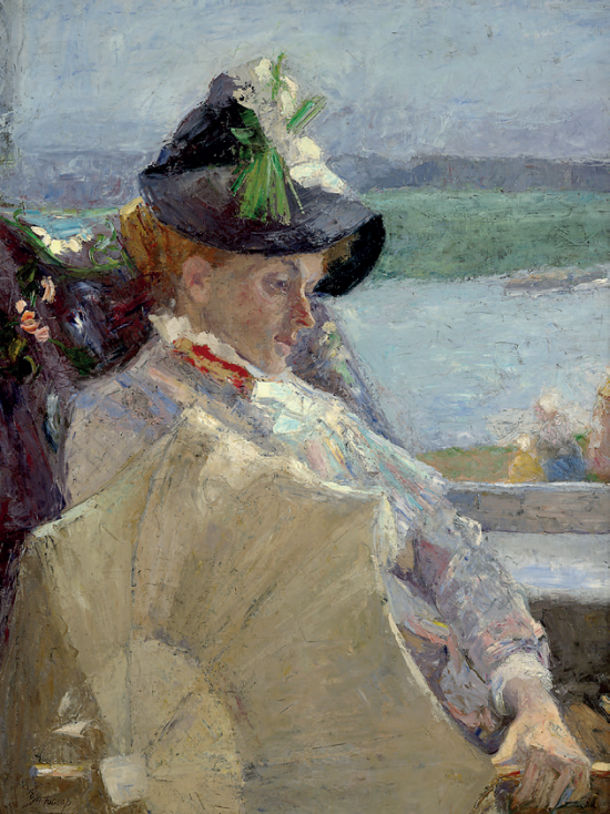
JAN TOOROP, DAME À L'OMBRELLE, 1888, HUILE SUR TOILE.