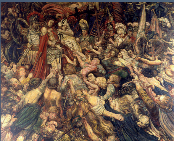
VILLE D'AVIGNON, PALAIS DU ROURE, FONDATION FLANDRE/SY-ESPÉRANDEU