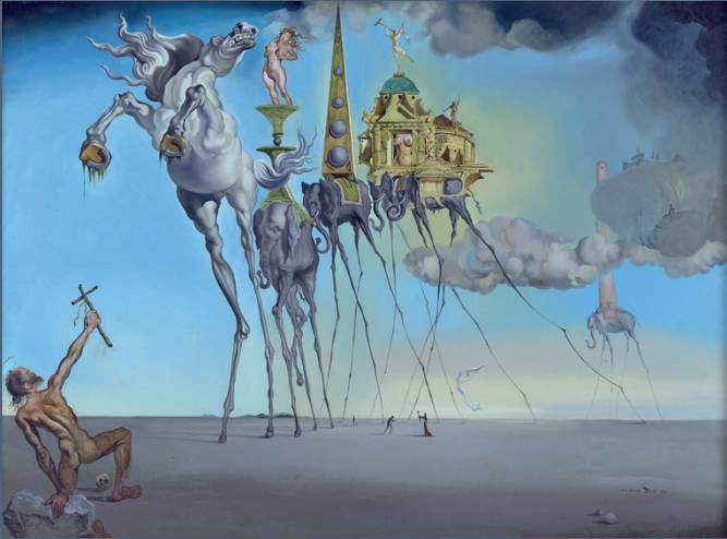
© SALVADOR DALÍ, FUNDACIÓ GALIÀ-SALVADOR DALÍ, FIGUERES. PHOTO: J. GELEYS - ART PHOTOGRAPHY