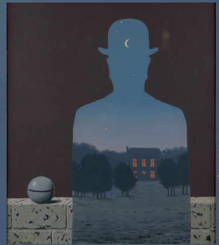
RENÉ MAGRITTE, L'HEUREUX DONATEUR, 1966, HUILE SUR TOILE.