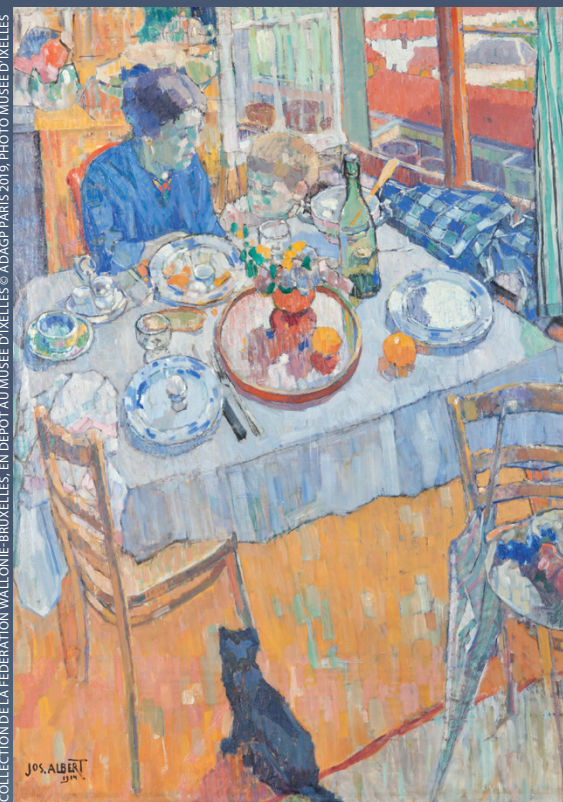
JOS ALBERT, GRAND INTÉRIEUR, 1914, HUILE SUR TOILE.