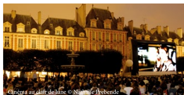
Cinéma au clair de lune