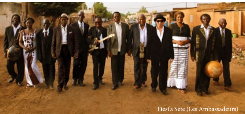
Fiest'a Sète (Les Ambassadeurs)