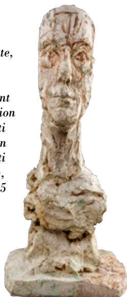
Grande tête, 1945, état de 1965. Plâtre peint © Succession Giacometti (Fondation Giacometti + ADAGP), Paris, 2015