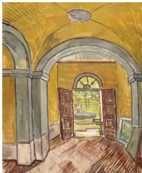
Vincent Van Gogh, Le vestibule de l'asile , 1889. Peinture à l'huile au pinceau, sur papier. Van Gogh Museum, Amsterdam (Vincent Van Gogh Foundation)