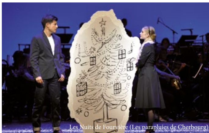
Les Nuits de Fourvière (Les parapluies de Cherbourg)