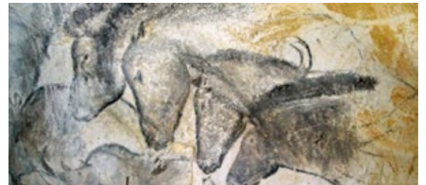
Le panneau des chevaux