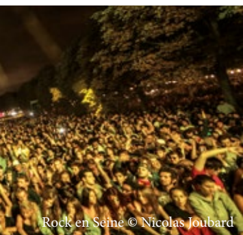
Rock en Seine