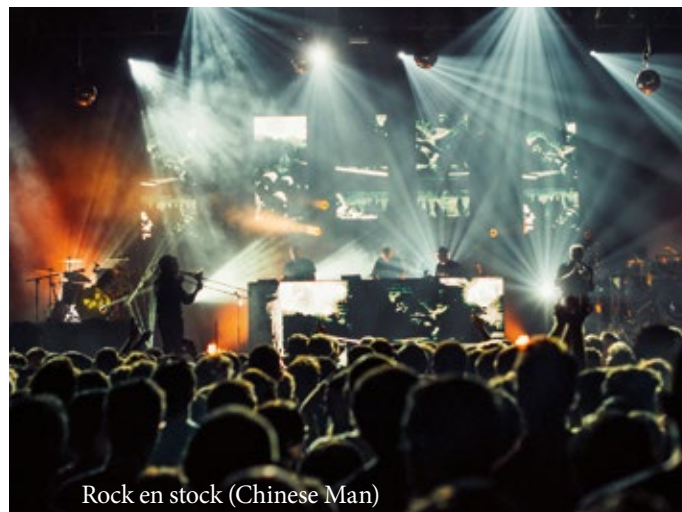
Rock en stock (Chinese Man)