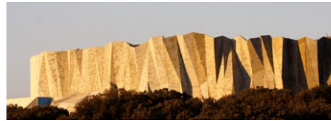
Caverne du Pont d'Arc. La falaise de la grotte recréée. Conception Fabre-Speller Architectes, Atelier 3A F Neau – Scène- Sycpa