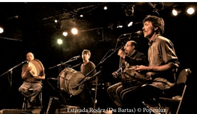
Estivada Rodez (Du Bartas)