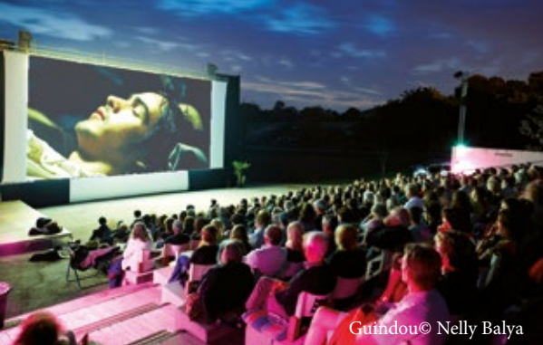
Guindou© Nelly Balya