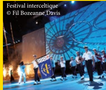
Festival interceltique