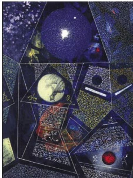
Max Ernst, Le monde des naïfs , 1965, huile sur toile ; datation en 1982 Paris, Centre Pompidou, Musée national d'art moderne - Centre de création industrielle