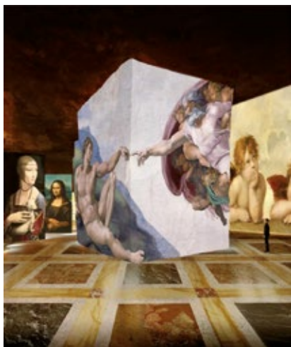
G. Iannuzzi © 2015. Photo Scala, Florence