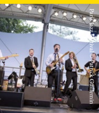
Paris Jazz Festival