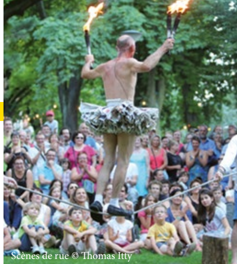
Scènes de rue