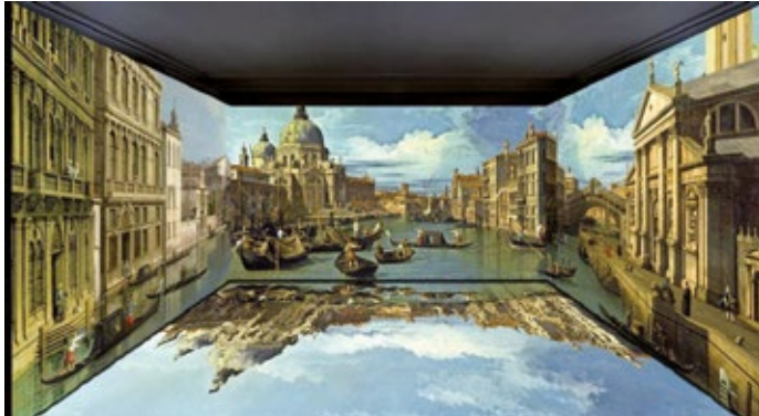
Gianfranco Iannuzzi, Capriccio Veneziano. Animation immersive sur le concept Amiex® de Culturespaces. © G. Iannuzzi / Culturespaces