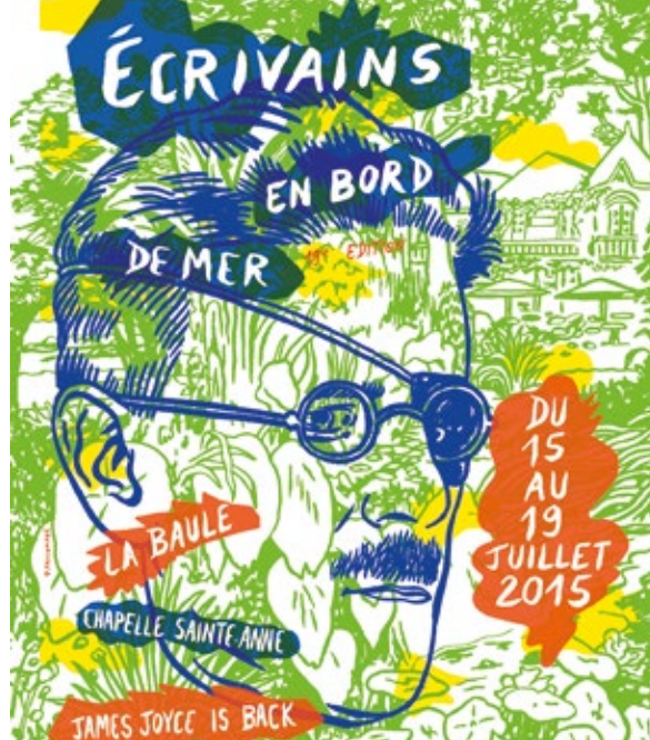
Écrivains en bord de mer © Bécé