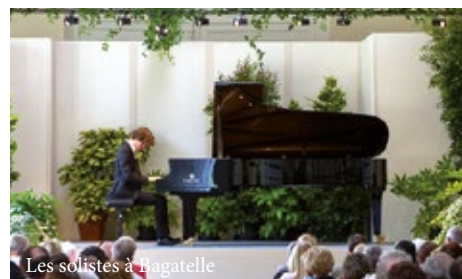
Les solistes à Bagatelle