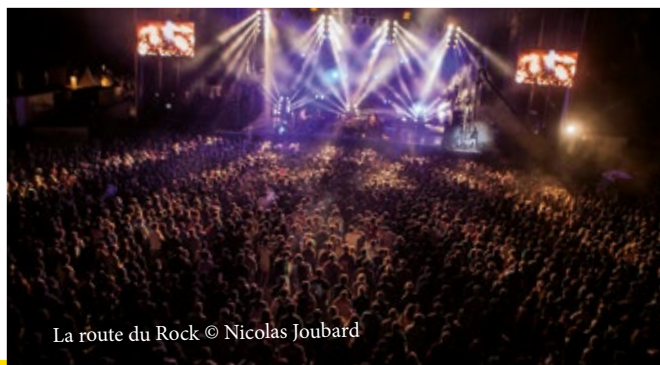
La route du Rock