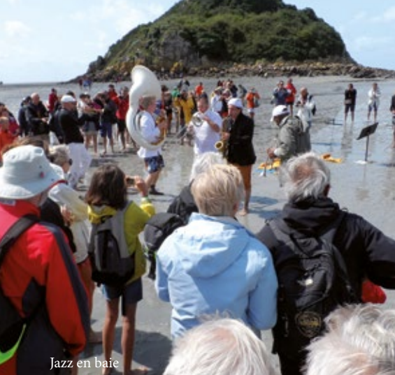
Jazz en baie