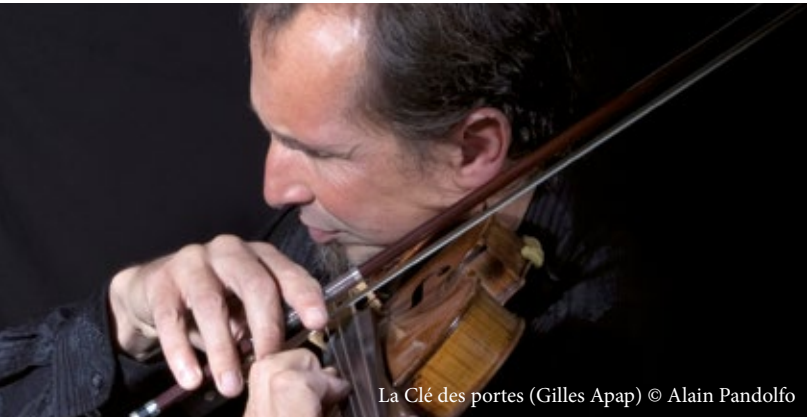
La Clé des portes (Gilles Apap)