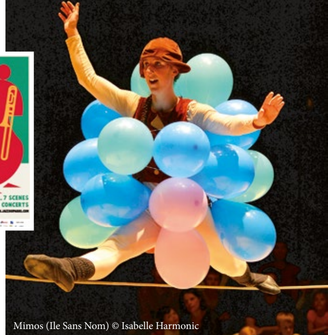
Mimos (Ile Sans Nom)