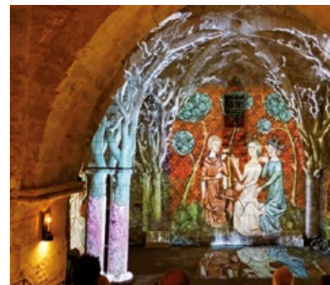
Crypte romane, Thomas Boivin. Métropole Rouen-Normandie. Anamnesia/Agence Farrell/Atelier Hoarau/XY Zèbre