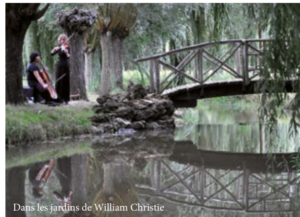
Dans les jardins de William Christie