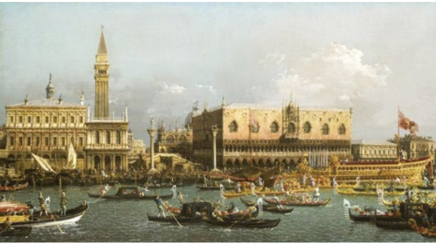
Canaletto, Venise, le Bucentaure de retour au Môle le jour de l'Ascension. 1760, huile sur toile