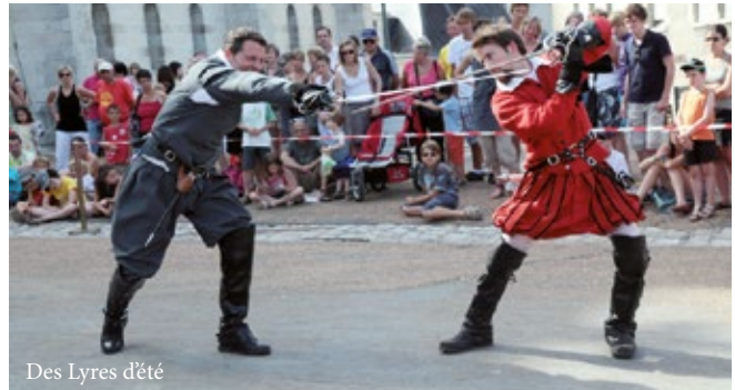
Des Lyres d'été