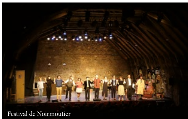
Festival de Noirmoutier