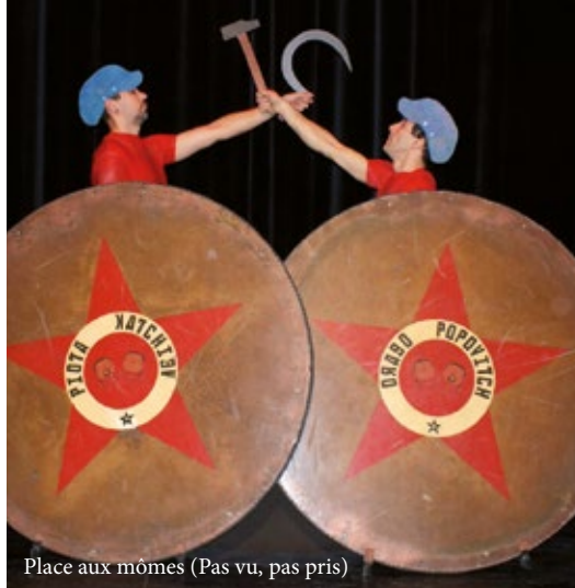
Place aux mômes (Pas vu, pas pris)