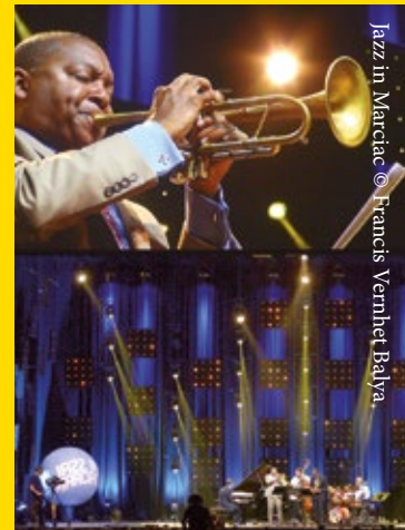
Jazz in Marciac

• Jazz in Marciac, du 27 juillet au 16 août Une nouvelle fois, ils seront tous là. Cette édition, rallongée et éclectique, fera la part belle aux légendes: Chick Corea, l'Orchestra Buena Vista Social Club mené par Omara Portuando ou Archie Shepp, Gilberto Gil et Caetano Veloso, Kenny Garret, Wynton Marsalis. Mais aussi Lisa Simone, Melody Gardot, un hommage à Paco de Lucia... Des rencontres, de l'émotion, de la joie! www.jazzinmarciac.com