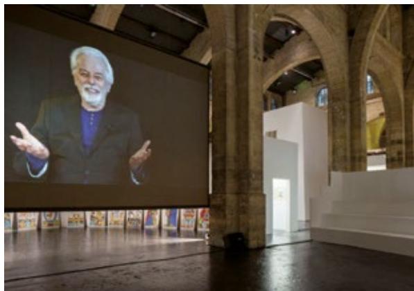
Alejandro Jodorowsky